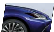
Azul Royal (8X5)