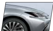
Prata Platinum (1J4)