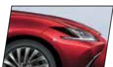
Vermelho Coral (3R1)