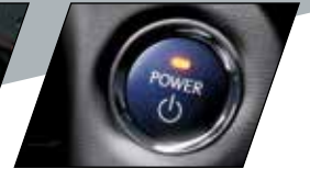
Sistema de ignição simplificado ao toque de um botão