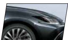
Preto Grafite (223)