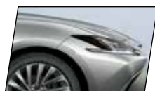
Cinza Titânio (1J7)