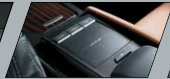
Controle central touchpad: acesso às funções do sistema multimídia com o toque dos dedos, sem tirar a mão do console central