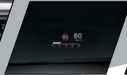
Head-up Display (com informações sobre velocidade, navegação GPS, áudio e assistente de direção)