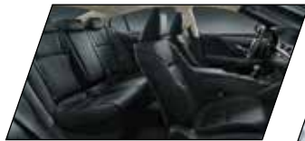
Banco do motorista com regulagem para dez posições, sistema Easy Access, memória para três perfis e ajuste das pernas e lombar