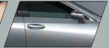
Os sensores nas portas dianteiras e no porta-malas destravam o carro automaticamente ao se aproximar a chave (Smart Entry)