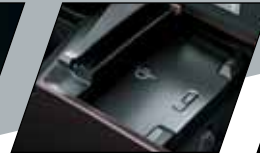
Carregador para celular sem fio