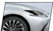
Branco Sônico (085)