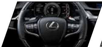
Coluna de direção com memória