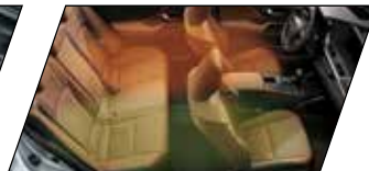
Ar-condicionado dual zone e sistema de aquecimento e ventilação para os bancos frontais (motorista e passageiro)