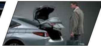
Comando elétrico interno para abertura e fechamento do porta-malas e sistema hands-free