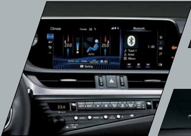
Sistemas de conectividade Apple CarPlay®, Android Auto® e Miracast com tela de LCD de 12,3" para o motorista. Acesso às funções da câmera de ré (com guide monitor), DVD player, sistema de navegação (GPS) e Bluetooth® por meio do controle Remote Touch

O ES 300h vem com sistemas de conectividade Apple CarPlay®, Android Auto® e Miracast e com o exclusivo sistema multimídia Lexus com tela de LCD 1 de 12,3" e funções de áudio compatíveis com DVD (a) , CD-R/RW, MP3, WMA 2 , AAC 3 e rádio AM/FM + TV digital (a) + sistema de navegação (GPS 4 ) (b) + câmera de ré + sistema Bluetooth® acessados pelo controle central Remote Touch. Quer mais? O ar-condicionado dual zone com tecnologia Nanoe umidifica os íons com partículas de água, evitando o ressecamento da pele e do cabelo dos ocupantes do veículo. Há também Head-up Display (HUD) colorido, que projeta no para-brisa informações sobre o veículo.